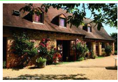
Auberge du Peyrol à Sergeac 05 53 50 72 91