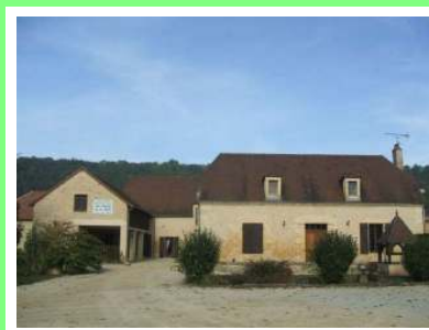
Lou Cantou Montignac